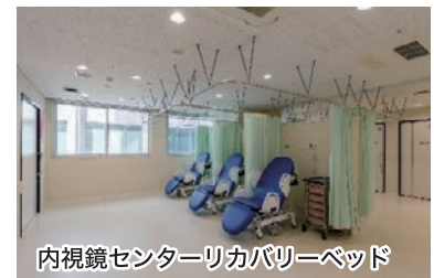
内視鏡センターリカバリーベッド