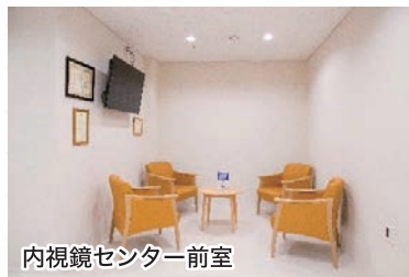
内視鏡センター前室