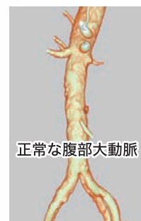
正常な腹部大動脈