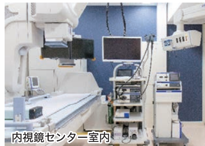
内視鏡センター室内