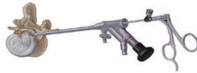
経皮的椎間板摘出術システム (PED/Wolf社)